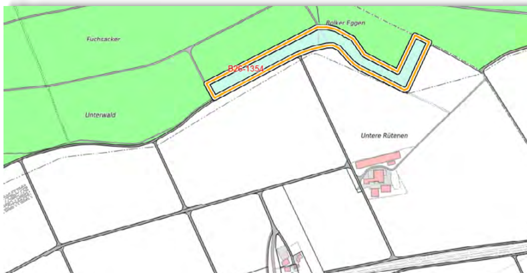
Kartenausschnitt von Etziken: Das Waldrandprojekt am Bolker Ecken (blau eingezeichnet) ist besonders günstig für wärmeliebende Pflanzen und Tiere.