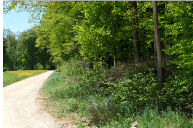
Das Waldrandprojekt am Erbeerihubel ist bereits abgeschlossen.

In Richtung Wald folgt eine Baumschicht aus kleineren, lichtliebenden Baumarten, bevor der geschlossene Hochwald beginnt. Diese gestufte Struktur wirkt ausgleichend auf das Waldklima, vermindert Windwurf