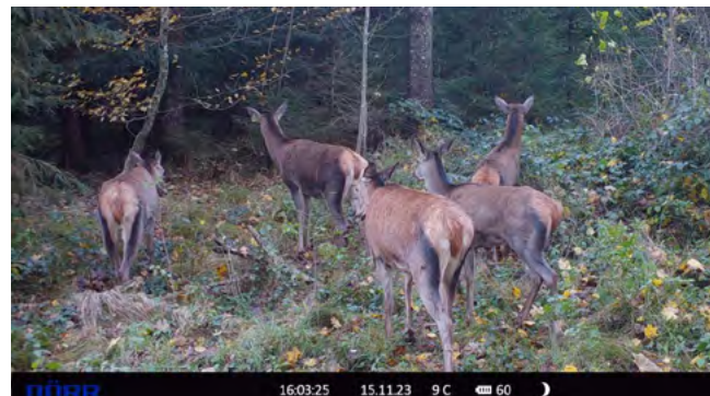
Fotos oben: Aufnahmen der Wildkamera zeigen Rotwild im Etziker Unterwald.