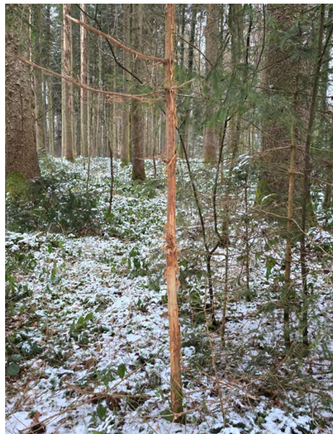
Foto unten: Verbisschäden durch Rotwild führen unter anderem zu Wachstumsstörungen bei jungen Bäumen.