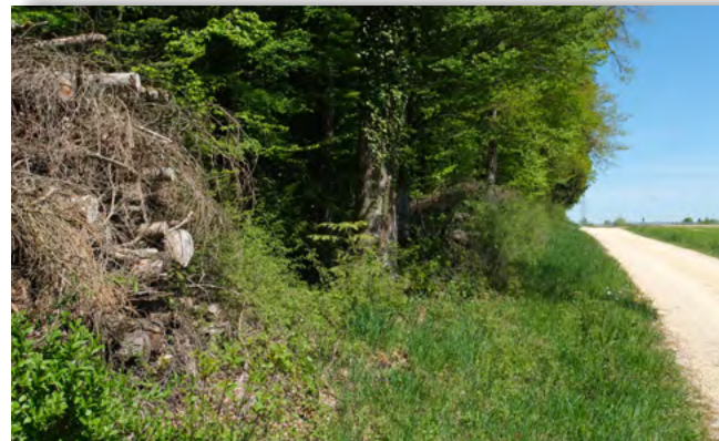
Asthaufen dienen Kleinsäugetieren wie Igel, Mauswiesel und Hermelin als Unterschlupf oder Winterquartier.